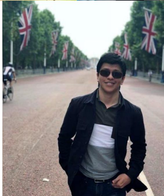
Movilidad e intercambio estudiantil