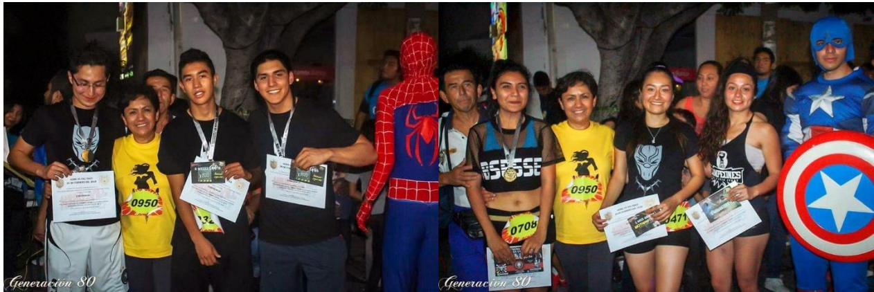
Cultura y Deporte